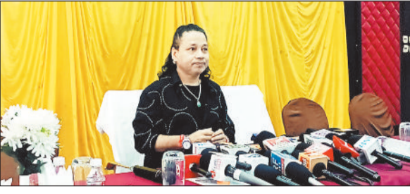
लोगों को फोक संगीत ही पसंद आता है। संगीत भारत के रंग पर बसा है। यहां तो भीक्षा मांगने वाला भी गाना गाकर भीक्षा मांगता है।

आप अन्वों को प्रकाशित करें। कल का शो बहुत ही प्यारा रहा, यहां चक्रधर समारोह में आना ही बहुत गजब रहा। शास्त्रीय संगीत के योगदान के बारे में उन्होंने कहा कि शास्त्रीय संगीत से पहले गांवों, गली मोहल्लों में लोक संगीत होता था जो हमारी असली पहचान है, वहीं से शास्त्रीय संगीत भी निकला है। पढ़े लिखे लोगों को शास्त्रीय संगीत पसंद आता है और कम पढ़े लिखे