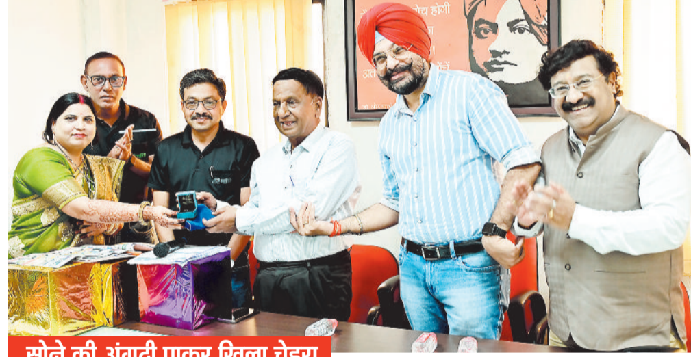
सोने की अंगूठी पाकर खिला चेहरा