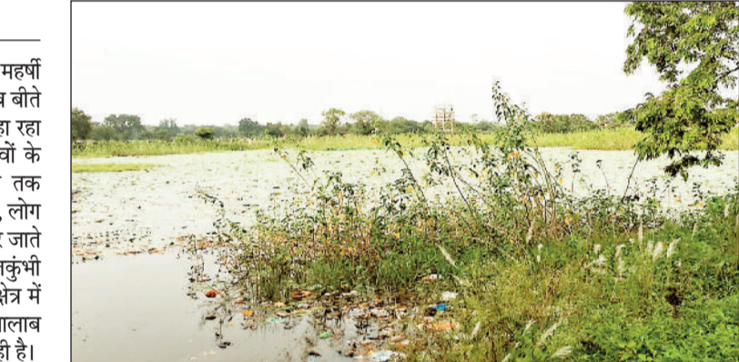
जलकुंभी व झाड़ू से पटा तालाब

शहर के विजयपुर वार्ड क्रमांक 47 में महर्षी स्कूल के आगे स्थित केंवटामुड़ा तालाब बीते 10 सालों से अपनी दुर्दशा पर आंसू बहा रहा है। कभी यहां दर्जनभर से अधिक गांवों के लोग नहाने आते थे, सुबह से शाम तक तालाब में लोगों भी भीड़ नजर आती थी, लोग पीने के लिए इस तालाब का पानी लेकर जाते थे, लेकिन अब यह तालाब गंदगी, जलकुंभी और झाड़ू से पट गया है। नगर निगम क्षेत्र में होने के बावजूद भी शहर सरकार इस तालाब के जीर्णोद्धार के लिए प्रयास नहीं कर रही है।