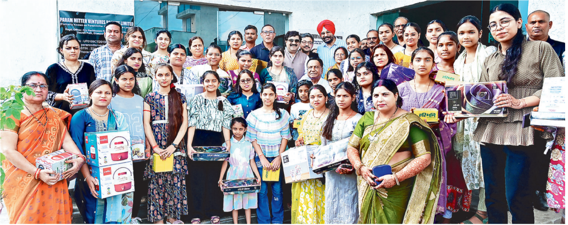
हरिभूमि की रंगोली, मेहंदी व सामान्य ज्ञान प्रतियोगिता के पुरस्कार वितरित